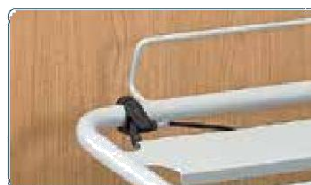
Sgancio d'emergenza del alza busto accessibile dalla testata e dai 2 lati del letto.

Alza gambe: potete scegliere fra varie versioni di alza gambe.