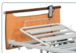
Alza busto elettrico (originale).

Schienale: potete scegliere fra varie versioni di schienale.