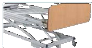
Alza gambe manuale a guide dentate.

Alza gambe: potete scegliere fra varie versioni di alza gambe.