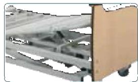
Alza gambe elettrico.