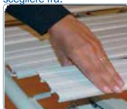
Ampie doghe staccabili in resina acrilica m2. Concepite per un maggior livello di comfort e igiene, garantiscono un'assoluta protezione anticorrosione.