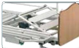
Alza gambe elettrico con piegatura.