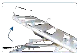
Alza busto a traslazione. permette di evitare uno scivolamento in avanti.