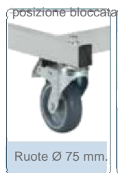
Ruote Ø 75 mm.