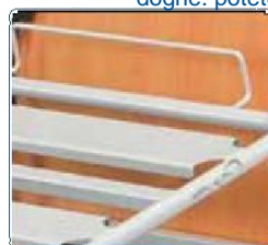
Ampie doghe in metallo saldate. Sono concepite per una facile manutenzione.