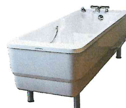
Modello ad altezza fissa Eco Line